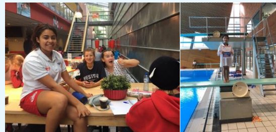
Plezier staat voorop en winnen is natuurlijk ook heel plezierig!